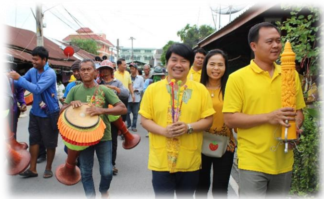
การตีกลองยาวและการเล่นเพลงกลองยาว