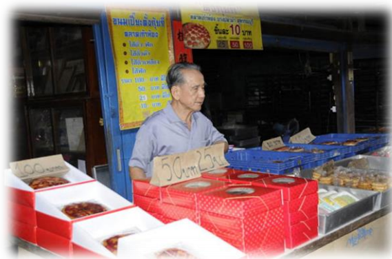
ผู้สืบทอดการทำขนมมงคล ของชาวไทยเชื้อสายจีน