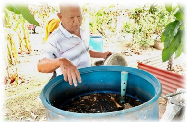
แหล่งเรียนรู้ชุมชน ครั้วเรื้อนต้นแบบเศรษฐกิจพอเพียง