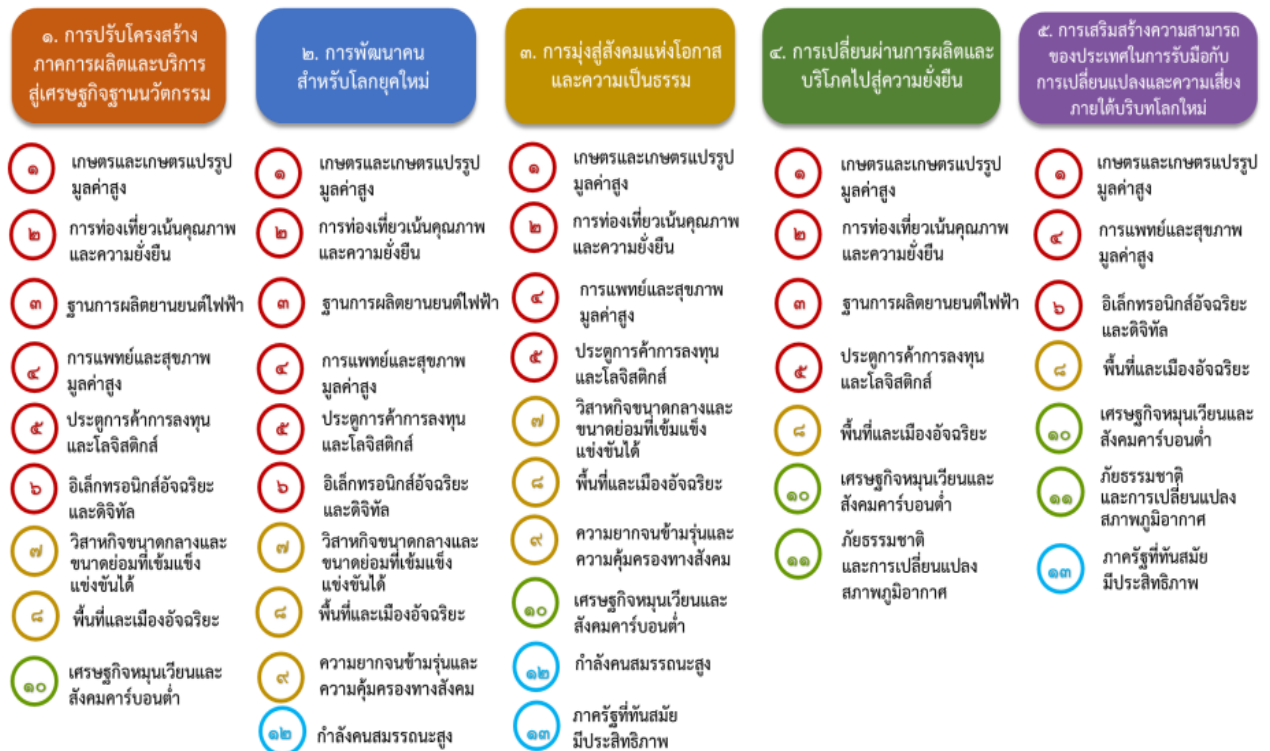
แผนภาพที่ ๓.๑ ความเชื่อมโยงระหว่างหมวดหมู่การพัฒนาที่เป้าหมายหลัก

ความเชื่อมโยงระหว่างหมวดหมู่การพัฒนาที่เป้าหมายหลักแสดงไว้ในแผนภาพที่ 3.1 โดยหมวดหมู่การพัฒนาที่กำหนดขึ้นเป็นประเด็นที่มีลักษณะเชิงบูรณาการที่ครอบคลุมการพัฒนาตั้งแต่ในระดับต้นน้ำจนถึงปลายน้ำ และสามารถนำไปสู่ผลพัฒนาทั้งในมิติเศรษฐกิจ สังคม ทรัพยากรธรรมชาติและสิ่งแวดล้อมไปพร้อมๆ กัน ทำให้หมวดหมู่แต่ละประการสามารถสนับสนุนเป้าหมายหลักได้มากกว่าหนึ่งข้อ นอกจากนี้การพัฒนาภายใต้แต่ละหมวดหมู่ไม่ได้แยกขาดจากกัน แต่มีการสนับสนุนหรือเอื้อประโยชน์ซึ่งกันและกัน